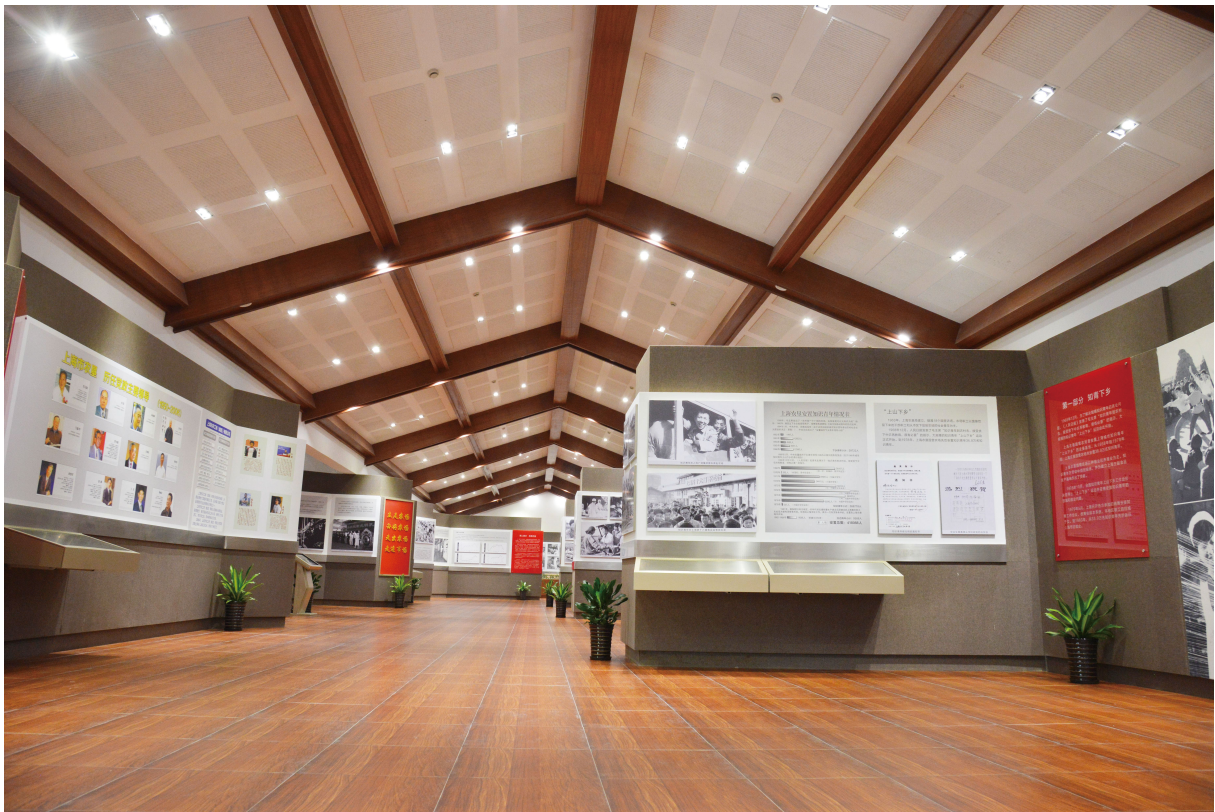
上海农垦博物馆二馆

光明食品集团拥有上海农垦博物馆和上海益民食品一厂历史展示馆两个爱国主义教育基地。上海农垦博物馆以厚重的农垦史实和独特的人文底蕴吸引了众多参观团体，上海益民食品一厂是现代食品工业的诞生地，老一辈艰苦奋斗的精神感染了一批批前来参观的学生和社会团体。这些教育场所为光明的建设者提供了接受精神洗礼的神圣场所，更为社会各界的青少年群体开设了接受爱国主义教育课外实践的第二课堂。