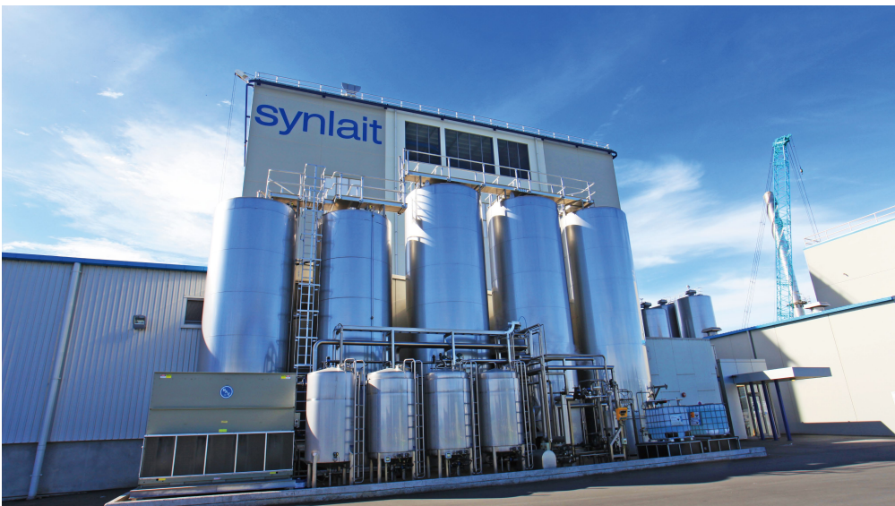
新西兰新莱特乳业工厂

光明还积极参与各项标准的制订及释义编写工作。如组织方信包装等包材企业参与GB4806.1-2016食品接触材料及制品系列标准实施问答的编写；与上海市FDA、中国食品工业协会冷冻冷藏食品专业委员会合作，发动相关企业筹划牛排相关产品质量标准的制定工作。集团所属梅林股份是全国食品工业标准化委员会罐头分技术委员会理事长单位，2016年参与了《食品热力杀菌设备热分布测试规程》和《罐藏食品热穿透测试规程》国标的起草申请工作；完成行业标准《果酱罐头》、《果汁罐头》、《雪菜罐头》、《榨菜罐头》、《枇杷罐头》、《坚果罐头》6项标准的函审工作。