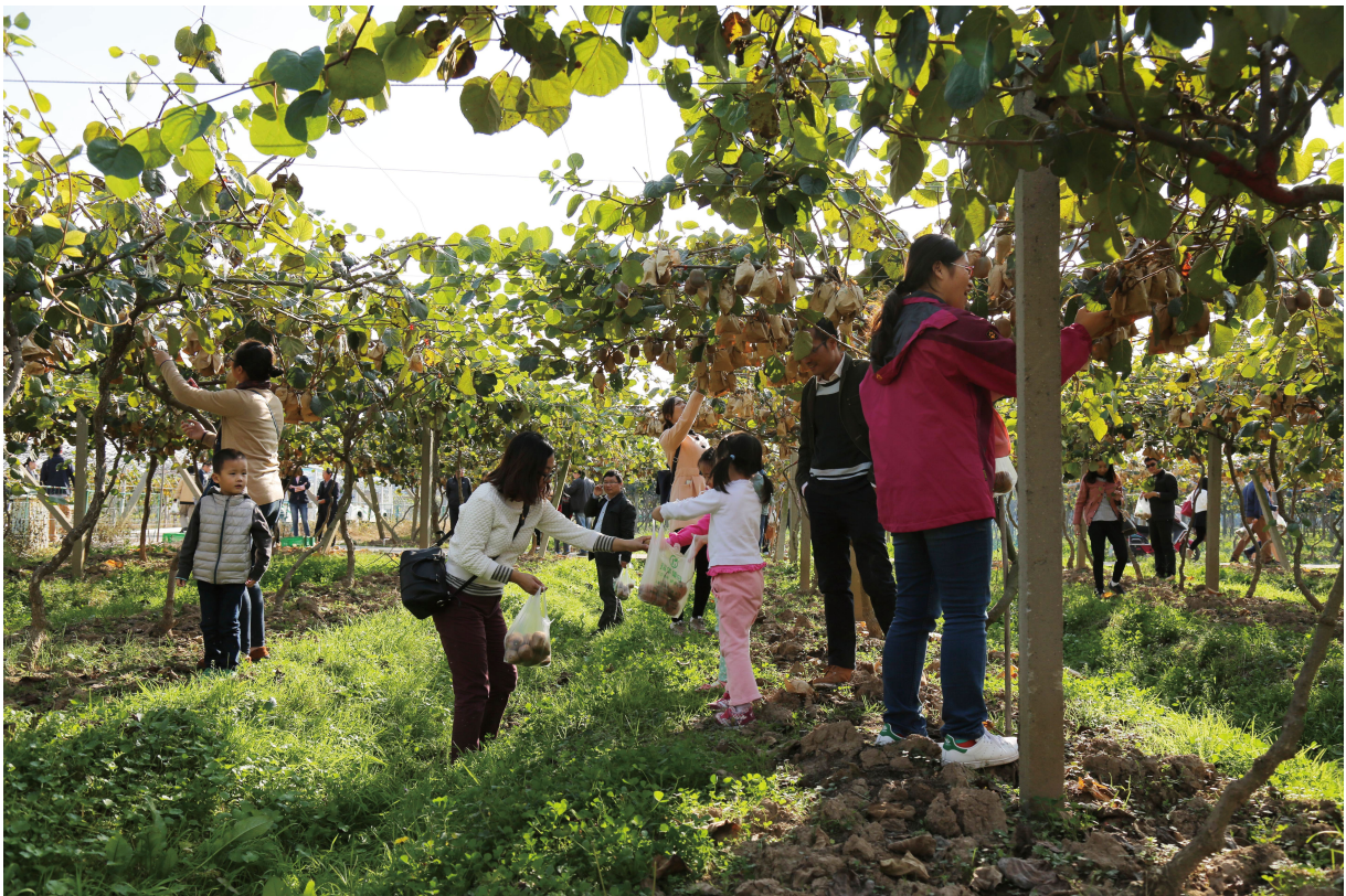
“光明员工看光明”活动：瑞华果园猕猴桃采摘

光明食品集团牢固树立“员工第一”的理念、弘扬“爱与尊重”的光明文化，积极为员工争取更多福利和保障，对有突出贡献的员工给予激励和表彰，提高员工的个人才能，促进发展。集团举办了隆重而简朴的光明食品集团庆祝“五一”国际劳动节先进颁奖仪式，举行了劳模（五一劳动奖章）先进表彰座谈会，上门慰问一线劳模先进、慰问海博劳模学雷锋车队等一系列活动。光明还举行了庆祝“三八”妇女节系列活动，召开集团党政领导与集团总部女职工座谈会，表彰先进个人和班组，还为女职工开设周末学校，安排插花讲座等课程，丰富职工生活。组织员工疗休养、体检、“光明员工看光明”等活动，参观集团产业基地，展示“劳动光荣、休养快乐”的精神风貌。